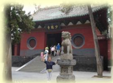
Templo de Shaolin

Al finalizar el seminario se entrega Cuaderno de Apuntes + DVD con la serie de ejercicios. Certificado de Asistencia expedido por Bcn wushu guan.